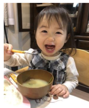
【美味しい笑顔 de 賞】