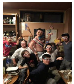
【楽しい笑顔 de 賞】